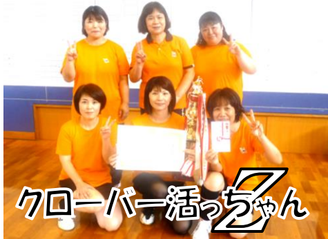
クローバー活っちゃん