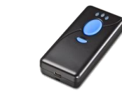
バーコードリーダー