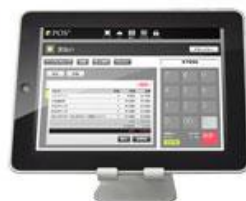
ネット de POSレジ