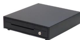
キャッシュドロアー