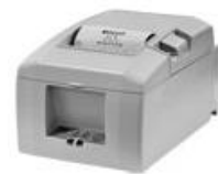
レシートプリンタ